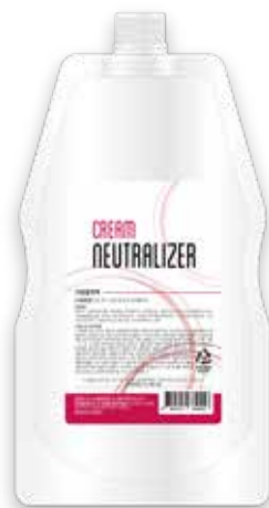
Cream Neutralizer 크림중화제 1000ml