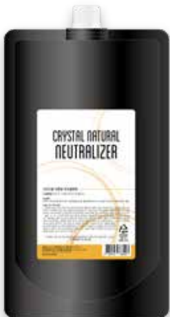
Crystal Natural Neutralizer 크리스탈 내추럴 액상중화제 1000ml